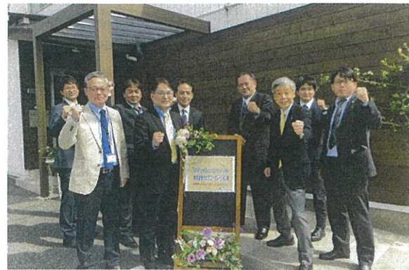
多くのお客様にご来社頂いています