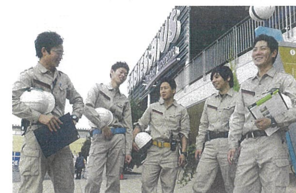
設備ファシリティ直営チーム