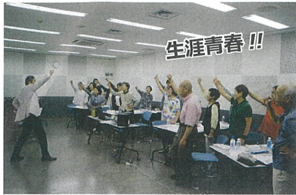
1997年から25年間続いている「さわやか研修会」

のはパート従業員の方たちで、私たちは「さわやか社員」と呼んでいます。さわやか社員の皆さんには、その建物がどうしたら心地よい空間になるか、ひと手間を惜しまない作業の徹底を心がけてもらっています。当社に清掃を任せてくれるお客様の満足度が向上していくことで、長年に亘ってリピートしてもらえ、他のお客様をご紹介してもらえるようにもなっていました。 ——そうした姿勢が「ファシリティマネジメント」につながっていくわけですね。