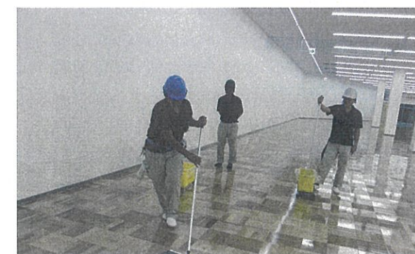
清掃革新・フロアコーティング

売上高全体の半分以上は清掃業務が占めています。そのため何よりも清掃現場の品質や評価が重要なのです。日常清掃の現場を担ってくれている